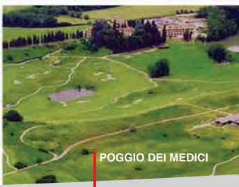
POGGIO DEI MEDICI